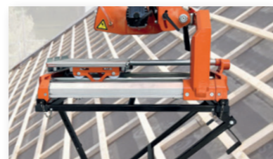
Dachtisch als Zubehör